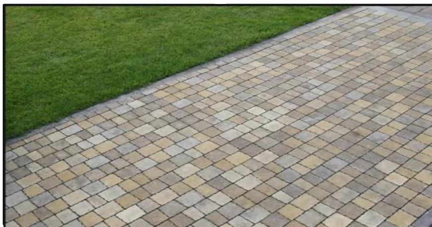
покрытие пешеходных дорожек элементы озеленения. газон