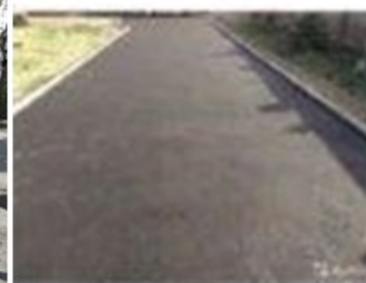
покрытие пешеходных дорожек