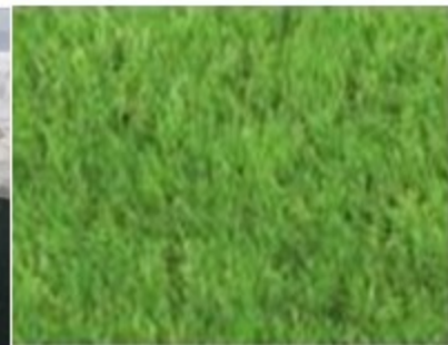
элементы озеленения. газон