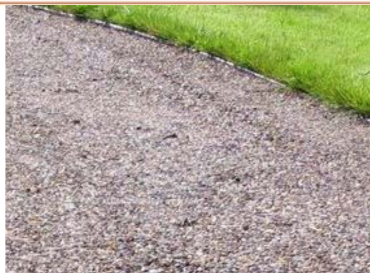
ПЛАНИРУЕМОЕ ПОКРЫТИЕ: НАБИВНОЕ